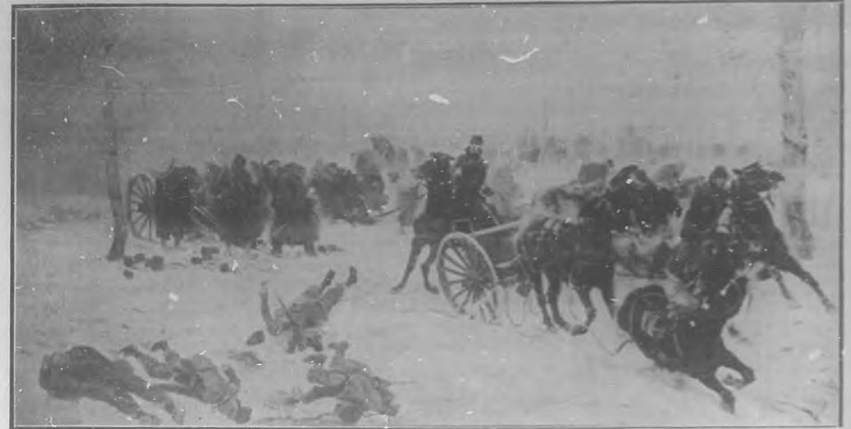
"En retirada".—Cuadro de Detaille. [Salón de París 1871.]

Desde este momento Edouard Detaille fijó los fastos militares franceses de diversas épocas, en cuadros largamente pensados, ejecutados con la más estricta conciencia, sin otra preocupación que la de alcanzar la perfección.