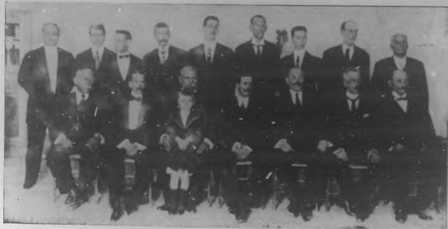
Grupo de la prestigiosa Directiva de El Liceo de Jesús del Monte.

ficios personales para sus asociados ha ampliado ya el círculo de su constitución, siendo una Sociedad de Instrucción, Recreo, Sport, Protección y Beneficencia y Sanidad, proponiéndose el Sr. Gay y la actual Directiva hacer todo género de esfuerzos para, á ser posible este año mismo, dejar construida la casa de Salud de la Sociedad.