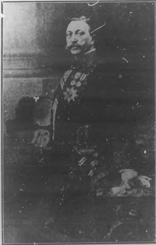
EDOUARD DETAILLE Fallecido recientemente en París. (Retrato por Aimé Moret).

mató con "Le Reve" en 1888, obra que pareció reasumir, el poderoso, el magnífico símbolo del amor á la patria y la gloria guerrera.