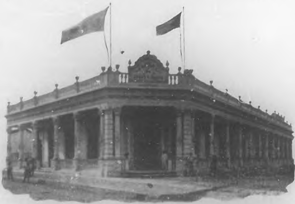
Vista del edificio del "Liceo de Jesús del Monte", recientemente inaugurado.