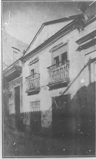
JOSE MARTI Nació en esta casa el día 28 de Enero de 1853 —Homenaje de la emigración de Cayo Hueso.