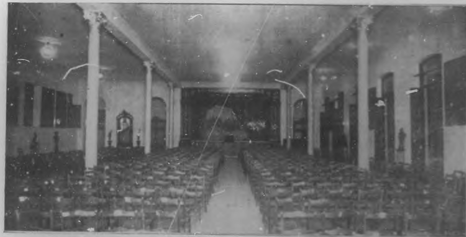
Liceo de Jesús del Monte. — Vista de la amplia sala de recepciones y bailes en cuyo interior puede verse el artístico escenario.

Sabido es que la explosión ocurrida en la ferretería del