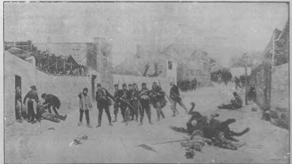
"El Reconocimiento".—Cuadro de E. Detaille.