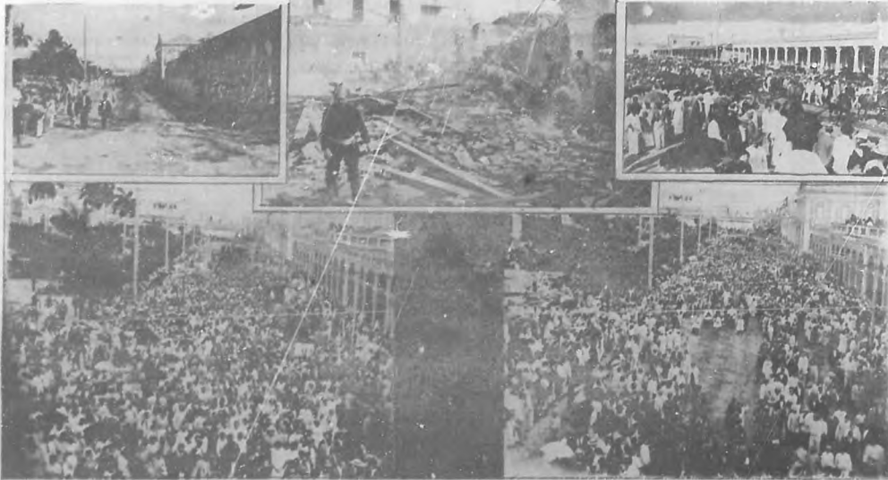
La catástrofe de Cienfuegos.—De izquierda á derecha: Salida del cortejo fúnebre de la casa Ayuntamiento.—Vista tomada durante el escombrecido desde la calle Santa Clara.—Paso del cortejo fúnebre por el paseo de Arango.—Manifestación popular de duelo durante el tránsito de las víctimas de Cienfuegos.—Tránsito del cortejo fúnebre por la calle San Fernando.