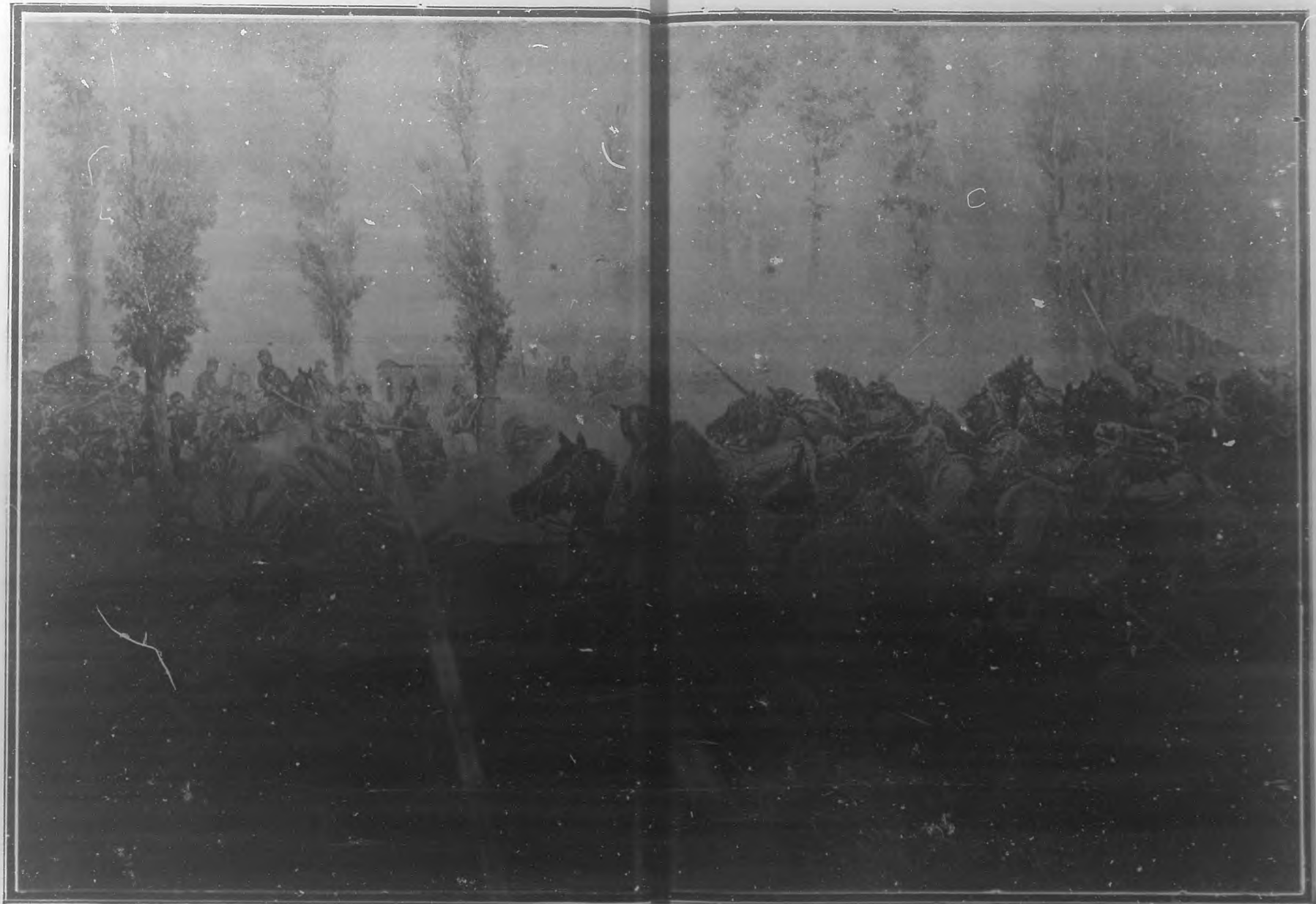
"ATAQUE DE UN CUADRO DE E. DETAILLE.