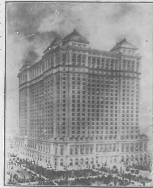
Vista general de lo que sería el edificio cuya construcción pretende la "Compañía de Construcciones y Fomento" y cuyo costo ascendería á $5,000,000.

Estas son á grandes rasgos las características del edificio acerca de cuya conveniencia se discute. Y nosotros, al publicarla, creemos ayudar á la opinión en la tarea de orientarse acerca del asunto.